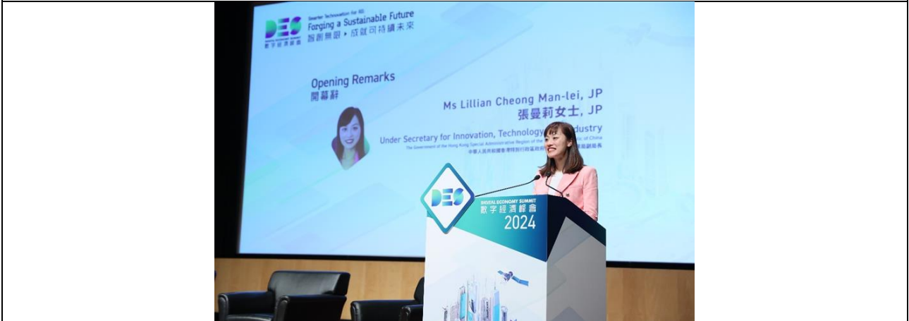
創新科技及工業局副局長張曼莉表示，期待與社會各界攜手合作，消除數碼鴻溝，共同以創科賦能平等社會，讓各界共享繁榮成果。